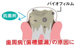
歯周病(歯槽膿漏)の原因に!!

食べカスなどに付着した口の中の細菌が歯垢(プラーク)になり、やがて歯ブラシでは落とせないバイオフィーム(細菌のかたまり)に成長していきます。バイオフィームが石灰化して固まると歯石になり、歯周病(歯槽膿漏)の原因になります。